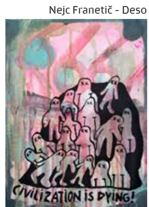
Nejc Franetič - Deso